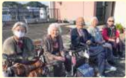
屋上で外の空気を楽しんでいる入居者の方、みなさん笑顔で過ごされています。

10周年を迎えたお祝いに港北のメンバーがお勧めするイチオシの消費材を揃えました。ぜひ、利用してくださいね。