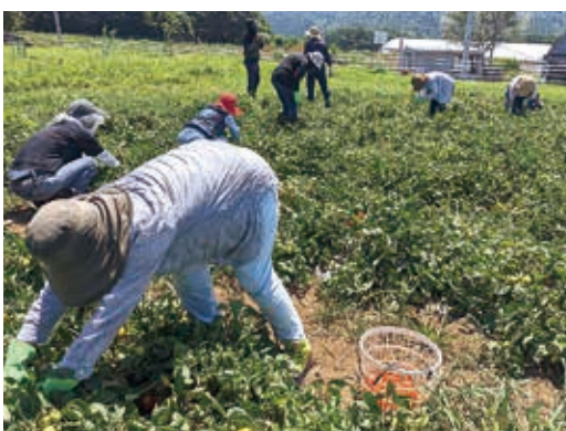
常にしゃがみながらの収穫は大変です

長い形状)は生食用とは違い、地面を這って伸びる無支柱の露地栽培で、皮が厚く果肉が多く追熟度が速い上、加熱するとおいしくなる。まさに加工用の品種です。