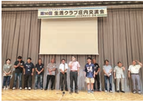
第50回庄内交流会式典

心折れて、一度だけ開発米作りを休んだそうです。昨年、組合員(神奈川田んぼクラブ)が応援に来てくれて、「頑張ってくださいね」と励まされ、やる気が出て再開したと嬉しそうに話していました。組合員が大ぜいで食べ続けることでの応援や、直接交流することが生産者の励みになっているのだと実感しました。