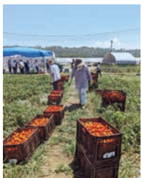
完熟トマトだけを収穫

毎年、50アールの畑の土づくりから始め、5月に1万本の苗を定植、7月中旬~8月末まで収穫し、それ以外の時は土を休ませます。このトマト(縦5cm、横3cmの細