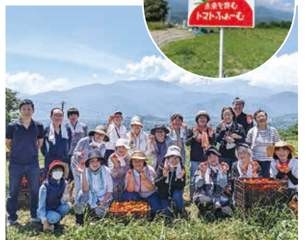
19名の参加で収穫体験(上)