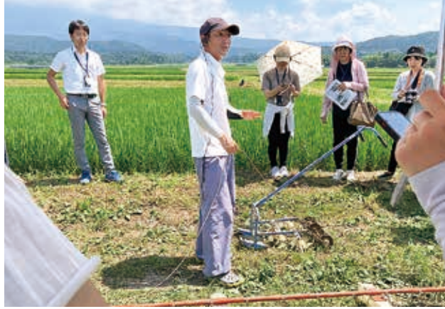
生産者のこだわりや米作りの苦勞が、納得のおいしさにつながっています

今年も交流会の目的の一つでもある、私たちが望むお米を確認してきました。 「長雨が続き、イモチ病が発生したので防除作業をしました。これから晴天が続くと思うので、稲の成長も半年並みと考えられます」と米農家の方は話していました。夏場は30度を超える暑さになることもしばしばで、雑草取り作業が大変とのこと。しかし、その作業をしないと元気な稲は育ちません。本当に頭が下がる思いでした。 ある農家の方は、コロナ禍で組合員との交流がなくなり、