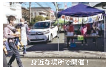
身近な場所で開催!