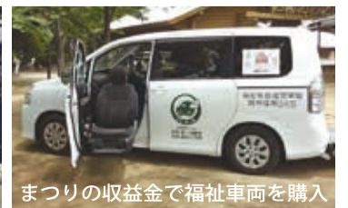
まつりの収益金で福祉車両を購入