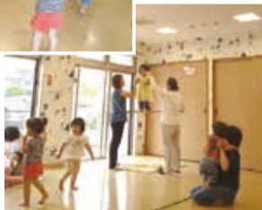
「ほっと・すぺーす」のリトミック体操

にロープで綱渡り、フラフープの輪でブランコや棒の上に立ったり等のアクロバティックなことにも挑戦。「できた時の笑顔がキラキラしていた」「来るたびに新しいことができたり」「家でもやってみたい。」など好評です。