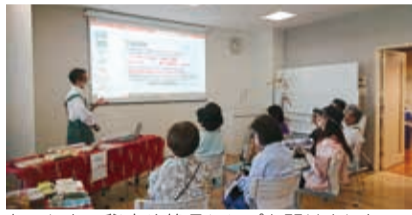
会場では生産者ニューオークボとヴィボンの消費材を紹介