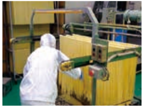
麺の長さをそろえ、竿掛け乾燥

次の工程では、摩擦で発生する熱を抑えるため、できるだけゆっくり製麺し、竿掛け乾燥をします。高温乾燥ではビタミンやアミノ酸が破壊し、味も栄養価も失われてしまうことから、40℃以下の低