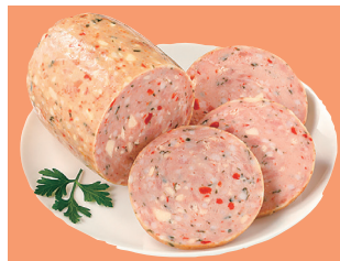
トマトチーズソーセージ

組合員と共に開発した「これ好き！トマトチーズソーセージ」の取り組みが始まります。開発期間は1年。組合員と話し合い、試食を重ねてでき上がりました。そのまま好きな