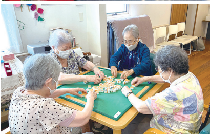
(上)近くへ散歩に(下)麻雀を楽しむ人も

コア大町 鎌倉市大町一丁目1-7-2 ☎「Day大町いしだ」0467(23)8495 JR横須賀線、江ノ島電鉄「鎌倉駅」より徒歩10分