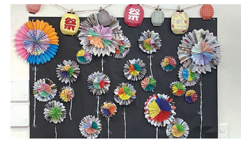
デイサービス利用者作花火の壁飾り

今回はコロナの影響により、直接訪問取材できなかったのが残念でしたが、「Day大町いしだ」のサービス責任者に複合福祉施設の良さを質問形式でうかがいました。その素晴らしいをお伝えします。