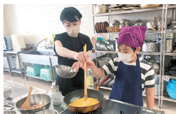
親子で卵焼き作り

野菜が届く「おまかせ野菜セット」も気に入っています。共働きなので週に1回の配達は大助かり！初めてイベントに参加した時に保育園児だった息子がもう小学5年生。家族で参加できる企画も楽しみのひとつです。