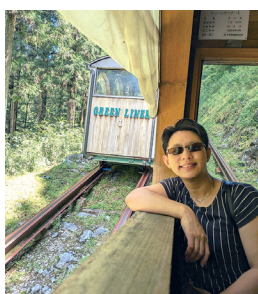
岐阜県大滝鍾乳洞へケーブルカーに乗って

久しぶりの「職員だよ」への登場です。さて、何を話したらいいかといういろいろ考えあぐねましたが、やはり趣味である車中泊旅行のことを、これまでと違うのは娘たちが社会人となり、日程を合わせることに苦慮していることです。以前は娘たちの予定そっちのけで計画していましたが、今は事前に予定の聞き取りをしています。自分自身も少々体力が落ちて、金曜の夜からの強行出発も出来なくなりました。でも、まだまだ行きたいところは山ほどあります。娘たちにも運転(少し怖いですが)してもらいながら、車中泊旅行をこれからも楽しみます。