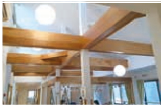
太い梁がおしゃれ

「メロディ～館」は、逗子葉山の1階には食事サービスW・Co「ぼかぼか」の厨房、家事介護サービスW・Co「よつ葉」、移動サービスW・Co「らむーぶ」逗子葉山「居宅介護支援W・Co」オプティ奏(かなで)の事務所が入っています。2階には小規模多機能サービス池子事業所があり、「通い」デイサービス「泊り」シヨートステイ「訪問」(自宅に訪問)のサービスを提供しています。