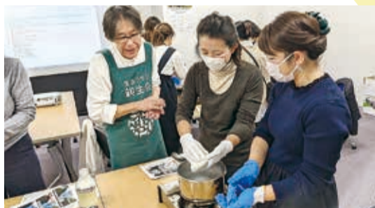
新生酪農モツアレチーズづくり