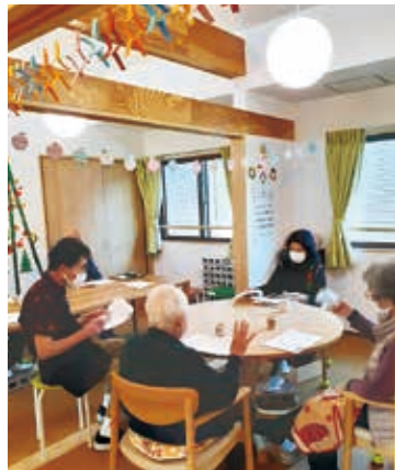
「通い」のデイサービス