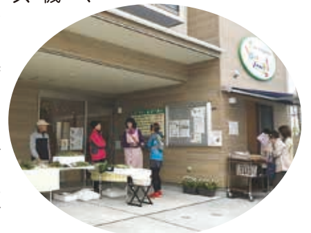
「池子市場」は毎月第4水曜日 10:00～12:00定例開催しています

1階の各W・Coの事務所では、和気あいあいながら、利用者の方たちの情報交換はしっかりと行っています。