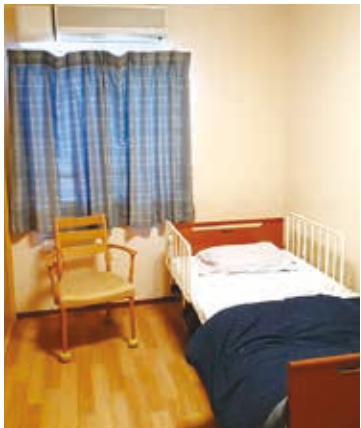
「泊まり」で利用できる居室

複合福祉施設「メロディ～館」 電話：046-874-7506 逗子市池子1-6-7 京急逗子線「神武寺駅」より徒歩約7分