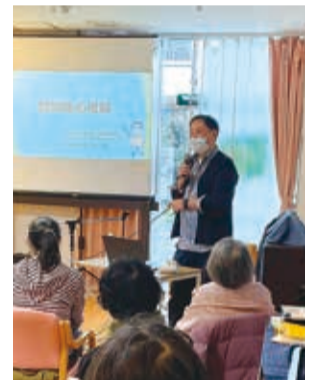
るるるオアシス認知症講座

毎月第4日曜日午後12時に「るるる＊みどり館」のダイニングルームで、地域のボランティアと十日市場ケアプラザの協力で福祉カフェ「るるるオアシス」を開催しています。おいしい紅茶を飲みながら、おしゃべりや読み聞かせ、健康チェックなどを行っています。