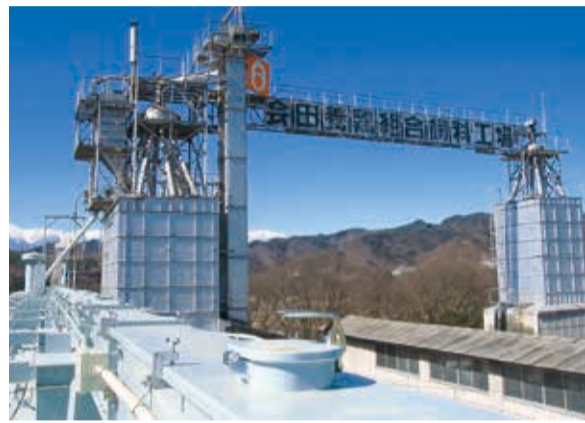
鶏卵業界でも極めて稀な飼料工場を保有しています

現在では輸入トウモロコシの飼料に占める割合を約23%にまで減らすことができ、魚粉などを含めて飼料のうち国産原料の割合は約4割です。