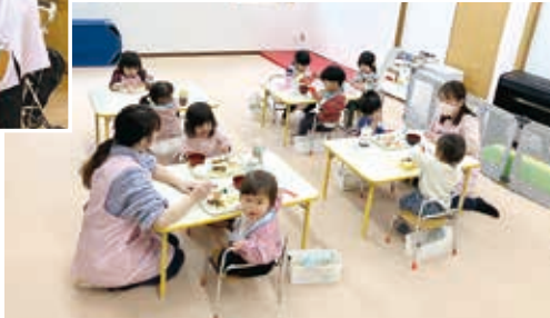
みんなうれしいお昼の時間

頼に伝えられるよう、メンバー募集に力を入れています。また事務所での取材では、他W・Coのメンバーと直接話して情報共有ができて、連携して対応できることが事務所が