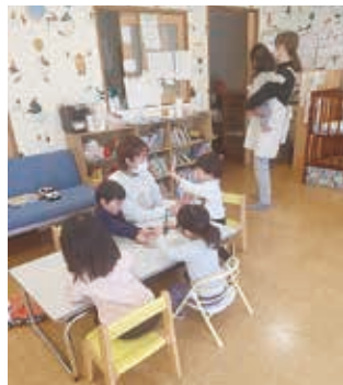
子どもたちの声がにぎやかです

派遣型事業、一時預かり保育、グループ保育、パッケージ保育と活動を拡げてきました。「みのり藤沢」開所に合わせて、活動拠点を藤沢市辻堂元町に移し、子どもたちや保護者が「ほっと」できる場づくりを心がけ、日々保育を行っています。家庭内での安全対策や、離乳食の相談を受