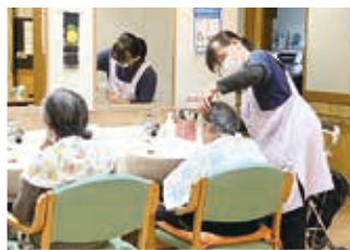
デイサービスで髪を整えてもらう利用者

「Dayひよし」では、定期的に健康チェックや生産者交流会、フェスタなどを開催。イベント時には地域の皆さんが集まり、いざという時に頼れる拠点です。 （上坂 渡邊） 「オプレ」とは、「あなたの支えになります」「あなたのそば