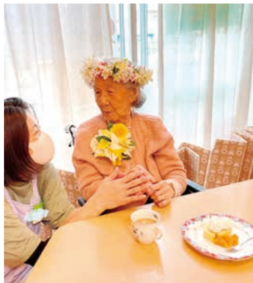
Happy 98th Birthday! ずっとずっと・・・Angel Smile お祝いしましょう

本人と介護者は「合わせ鏡」と言います。介護する方の心が乱れると、それはすぐ本人に伝わります。家族が行き詰ると在宅介護は難しくなります。「Dayみどり」では本人はもちろん、家族の支援を大切に考えています。家族が困っていることや、負担に感じていることを察して、「一人で頑張らないで、私たちにもお手伝いさせてくださ