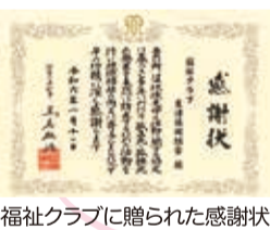
福祉クラブに贈られた感謝状

行政と連携を図り、孤立死・孤独死等を未然に防止することにより、地域住民の福祉の向上を目的としています。これからも、人々との信頼関係を大切に、私たち組合員の待機型ケアネットワークを拡げること、地域貢献へ寄与していきます。