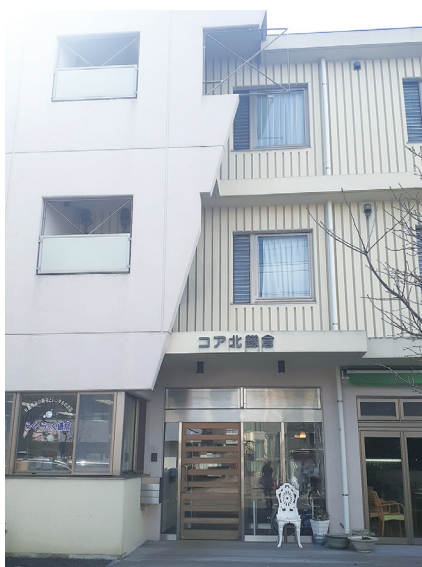
コア北鎌倉の玄関

は月々日曜日、鎌倉市内に届けています。入居者には体調に合った食事を提供。その他、デイサービス、用、近隣保育室の給食用、メンバー用の昼食や弁当など、1日約16