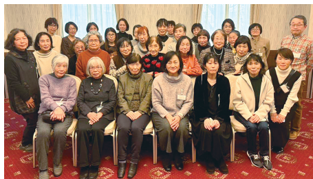
新年会で全員集合

れて嬉しい」と声をかけていただくことがよくあり、人と人が関わり合う大切さを日々感じています。私たちが伺うことで、住みなれた我が家で生活していただけるのならこんな嬉しいことはありません。利用者の笑顔に会いに、今日もメンバーは訪問します。(中村)