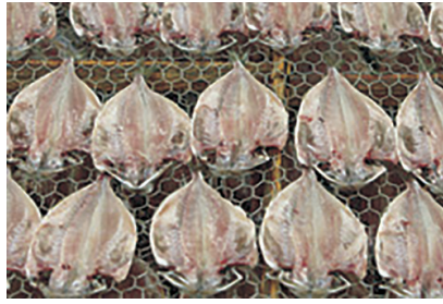
あじの開き干し風景

干物は焼くだけで献立のメインとなるので便利です。網がない場合は、フライパンで焼くこともできます。匂いや煙を敬遠する人もいますが、魚が