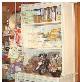
「らく・らく」鎌倉の陳列棚

14年設立のライフサポートW・Co「エールとも」は介護生活用品を扱う「らく・らく」鎌倉を運営しています。1階入口を入るとすぐ、陳列棚に並んだ品々を見て、手に取ることが出来ます。利用者の話を聞き取り、より良い生活のための提案をするとともに、最新情報を携え、出張講座もしています。おむつ給付の相談にも随時対応します。