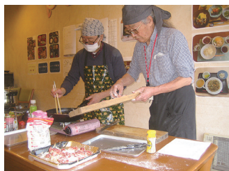
男の料理は人気の講座

04年10月に設立し、さまざまな講座を企画しています。利用は原則、組合員でサロン会員の方ですが、組合員外も利用できます。取材当日は「男の料理」の開催日で、ハッシュドビーフを作っていました。