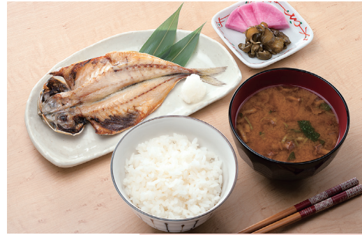
干物を使って簡単にバランスの取れた和食献立に

干物は、調理の手間がかからない食品です。その歴史は古く、奈良時代に天皇に献上されたという記録が正倉院に残っています。魚の水分を天日干しで抜くことにより腐敗菌の増殖が抑えられ、日持ちが良くなり、しかも水分が減った魚は旨味成分が凝縮されます。