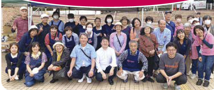
2024年「ふくしまつり」宮前区の会場で

移動サービス車には「羽がついたかわいい車」のロゴマークが付いています。移動サービスW.Co「らら・むーぶ」の「らら」には「らんらんらん！楽しく、気軽にお出かけしましょう！」という意味が込められています。お出かけ先への送り迎えだけでなく、車内での会話や様子からも利用者の変化を感じ取り、ケアにつなげています。今日も「らら・むーぶ」のメンバーが運転する移動サービスの車は活躍しています。