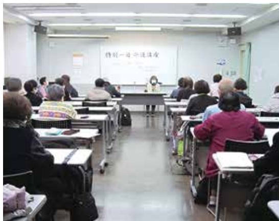
だれでも参加できる「特別一日介護講座」

楽になりました。」とっていただき、地域の方と一緒に学び合う有意義な一日になりました。(植生)