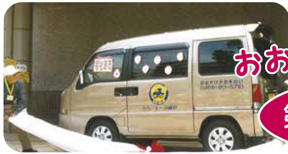
藤沢一号車お披露目