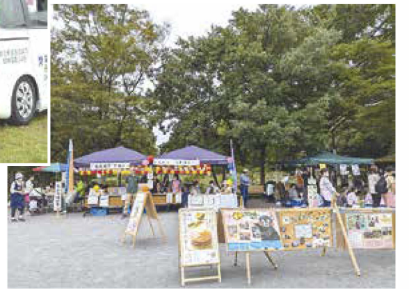
ふくしまつりでは安全でおいしい消費材の試食もできます