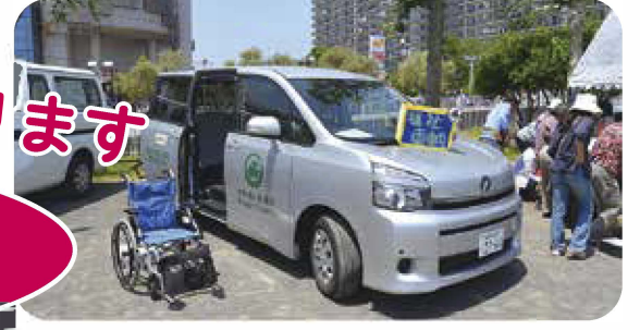
ふくしまつりで展示される「らら・むーぶ」の福祉車両