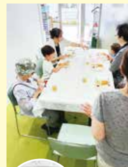
地域食堂は 大人も 子ども 利用できます

もともと料理が好きで、子育て中は近所のママ友と料理を持ち寄り、大人はおしゃべり、子どもたちは自由に遊んでいる雰囲気が好きでした。今の若い子育て中の方にとっても、「ポラン幸」がそのような居場所になったら良いなと思って始めています。(幸区 A)