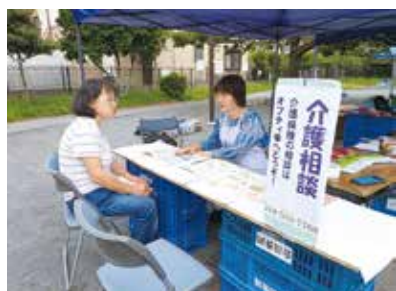
ふくしまつりで介護相談

2000年4月に介護保険制度が始まり、福祉クラブも、制度の当事者として市民の側に立った目線で運営すること、制度をつくりかえることを目的に参入しました。一人ひとりの暮らしのニーズ