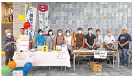
「ふくしま祭り」は、中町大通り地下道で開催しました

1997年に厚木市での消費材配達を始め、2001年、世話焼きW・Co「すみれ」設立。2004年に家事介護W・Co「みんなの手」が設立。2016年には移動サービスW・Co「らら・むーぶ厚木」が設立しました（現在再スタートに向けて準備中）。