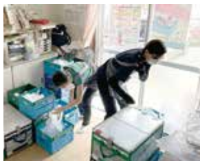
「すみれ」は1階で仕分け作業

今回訪問したのは、25年1月に移転した事務所で、閑静な住宅街にあり、アットホームな場所。まるで友だちの家に遊びに来たような、そんな優しい空気が流れています。迎えてくれたメンバーの方たちはとても温かく、居心地の良さを感じながら話を聞かせてもらいました。いろいろな兼務で忙しい中、時間をやりくりしながらワークしています。