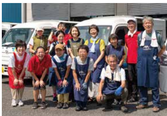
これからも笑顔で配達します

これからも次世代につなげていくため、福祉クラブについて知ってもらい、消費材の良さを知ってもらいたい！そのための新しい試みとして、「はまゆう」で Instagram を始めました。まだまだ試行錯誤の段階ですが、生産者交流会やイベントのお知らせ、消費材の紹介などを発信して、もっと内容を充実させていきたいと思っています。みな