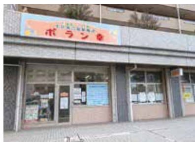
幸区の複合福祉施設「ポラン幸」

「オブティ」では利用者が、ヘルパーを必要とする時、利用者に近い事業所や要求に対応できる事業所などを優先的に考えて選択しています。その中で W.Co は心強い存在です。「ポラン幸」では訪