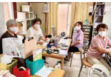
2階事務所に集うW.Coのメンバー